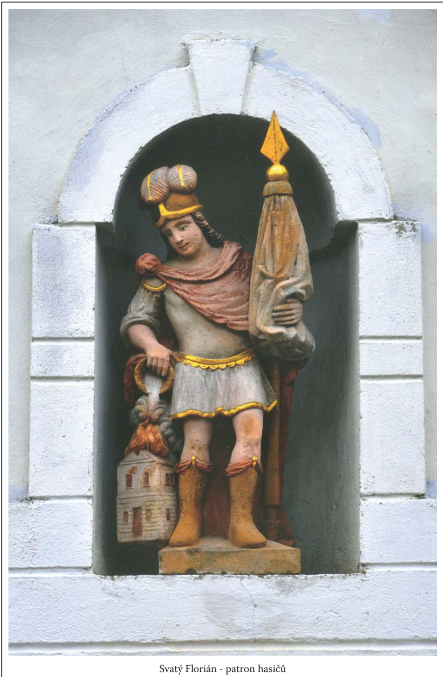
Svatý Florián - patron hasičů