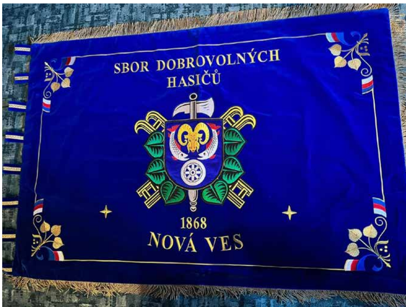
Sbor dobrovolných hasičů Nová Ves