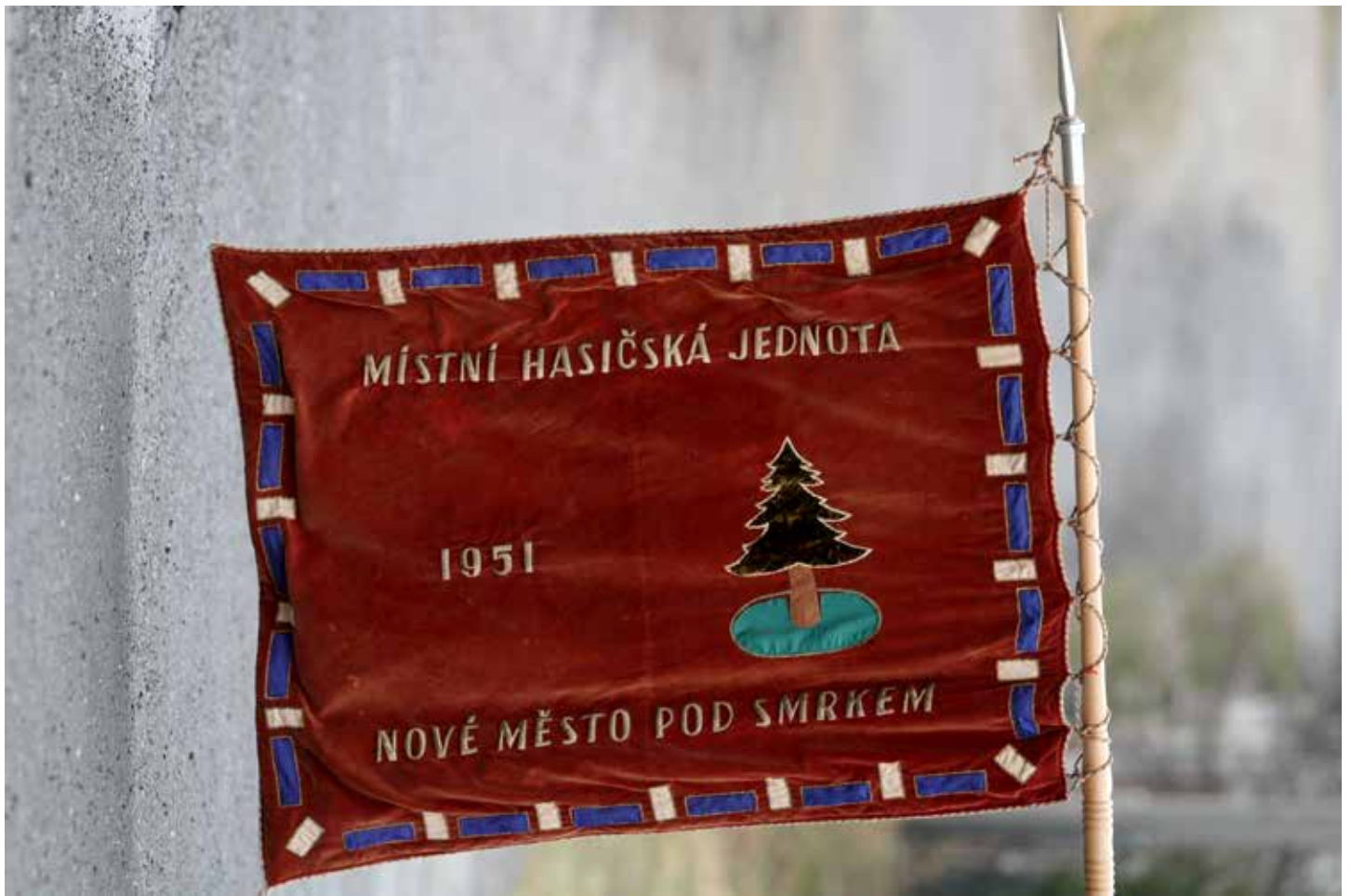
Sbor dobrovolných hasičů Nové Město pod Smrkem