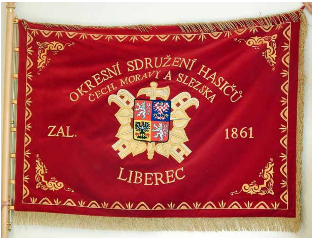
Prapor Sdružení hasičů Čech, Moravy a Slezska okresu Liberec