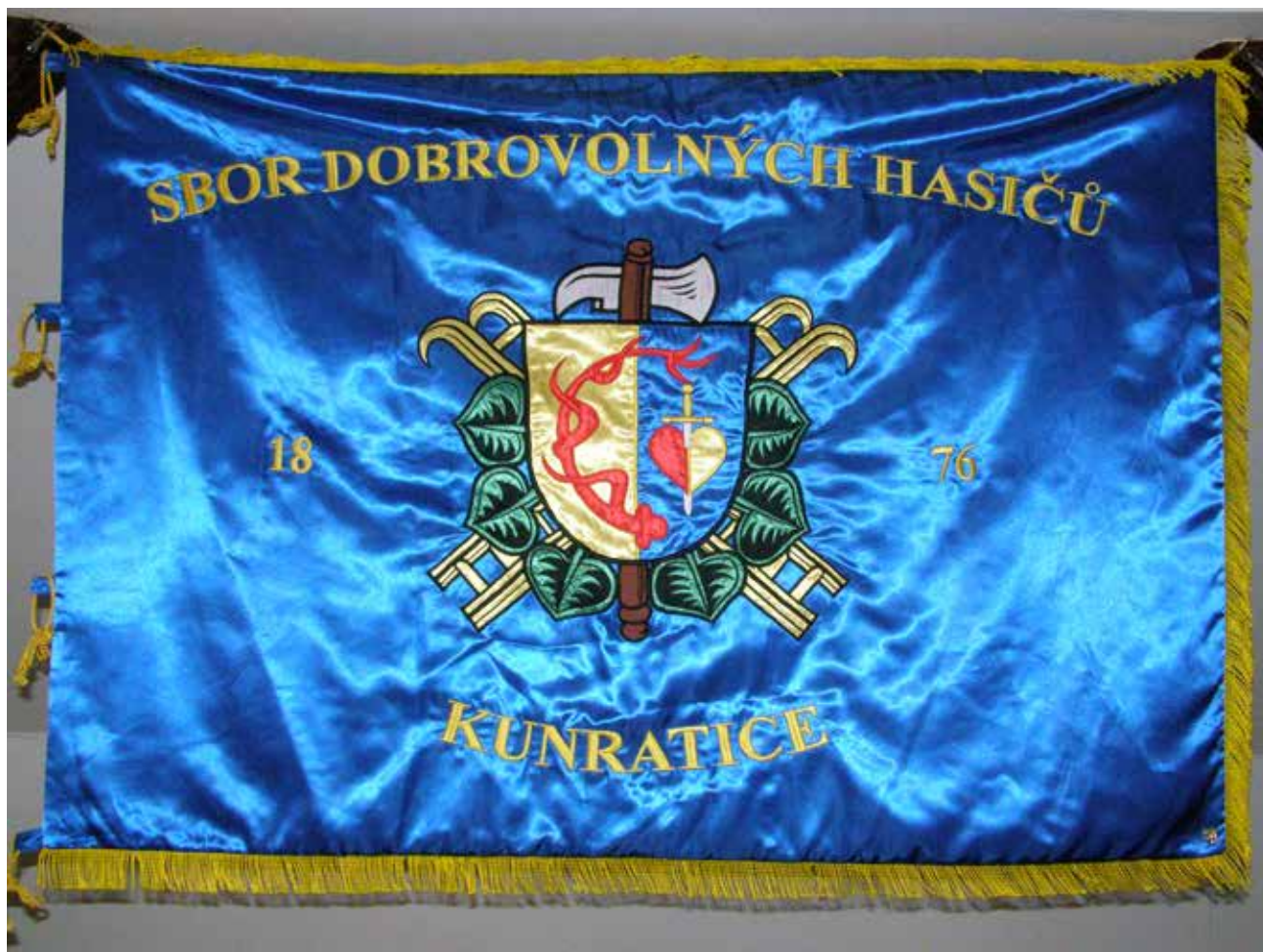
Sbor dobrovolných hasičů Kunratice