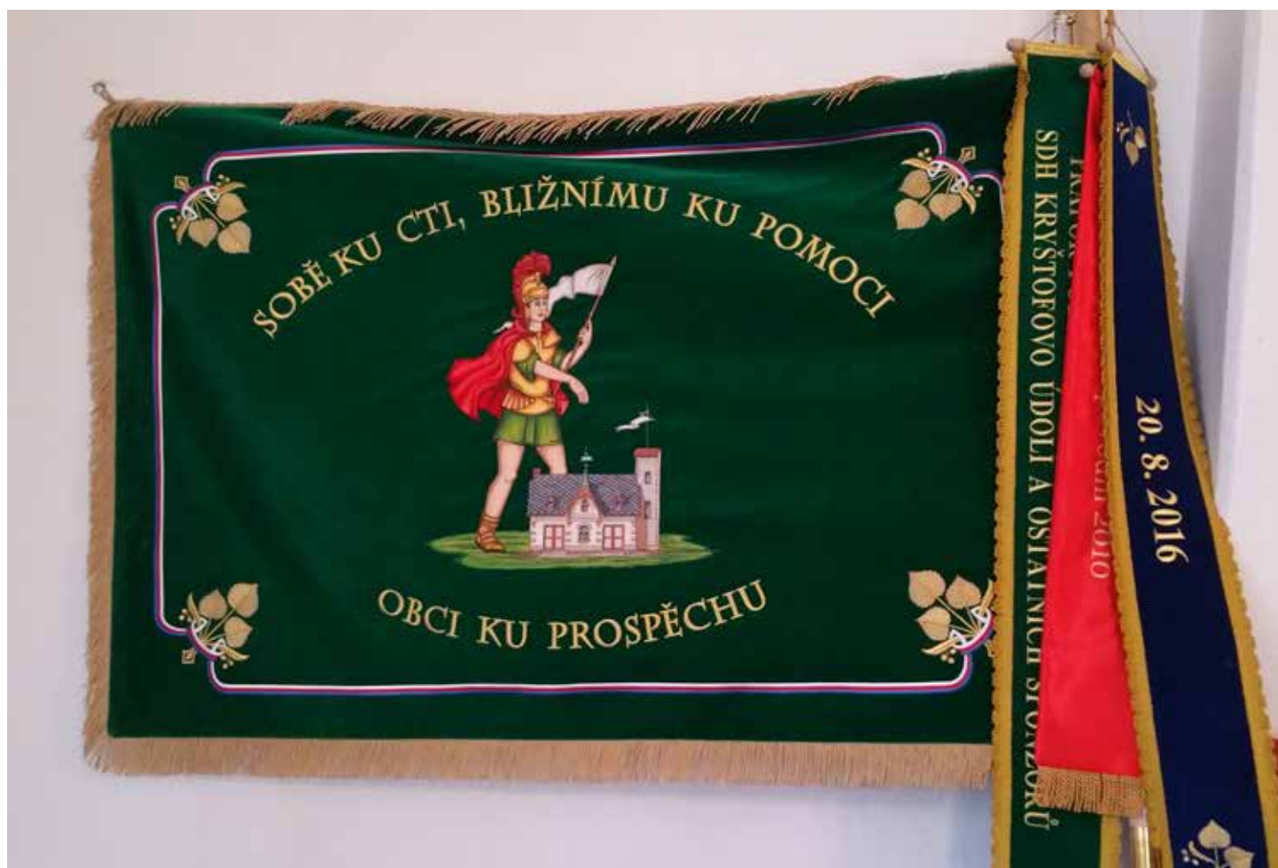
Sbor dobrovolných hasičů Oldřichov v Hájích