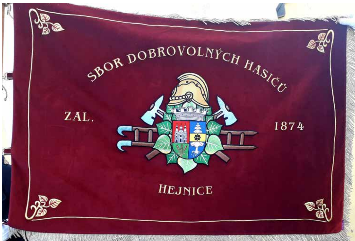
Sbor dobrovolných hasičů Hejnice