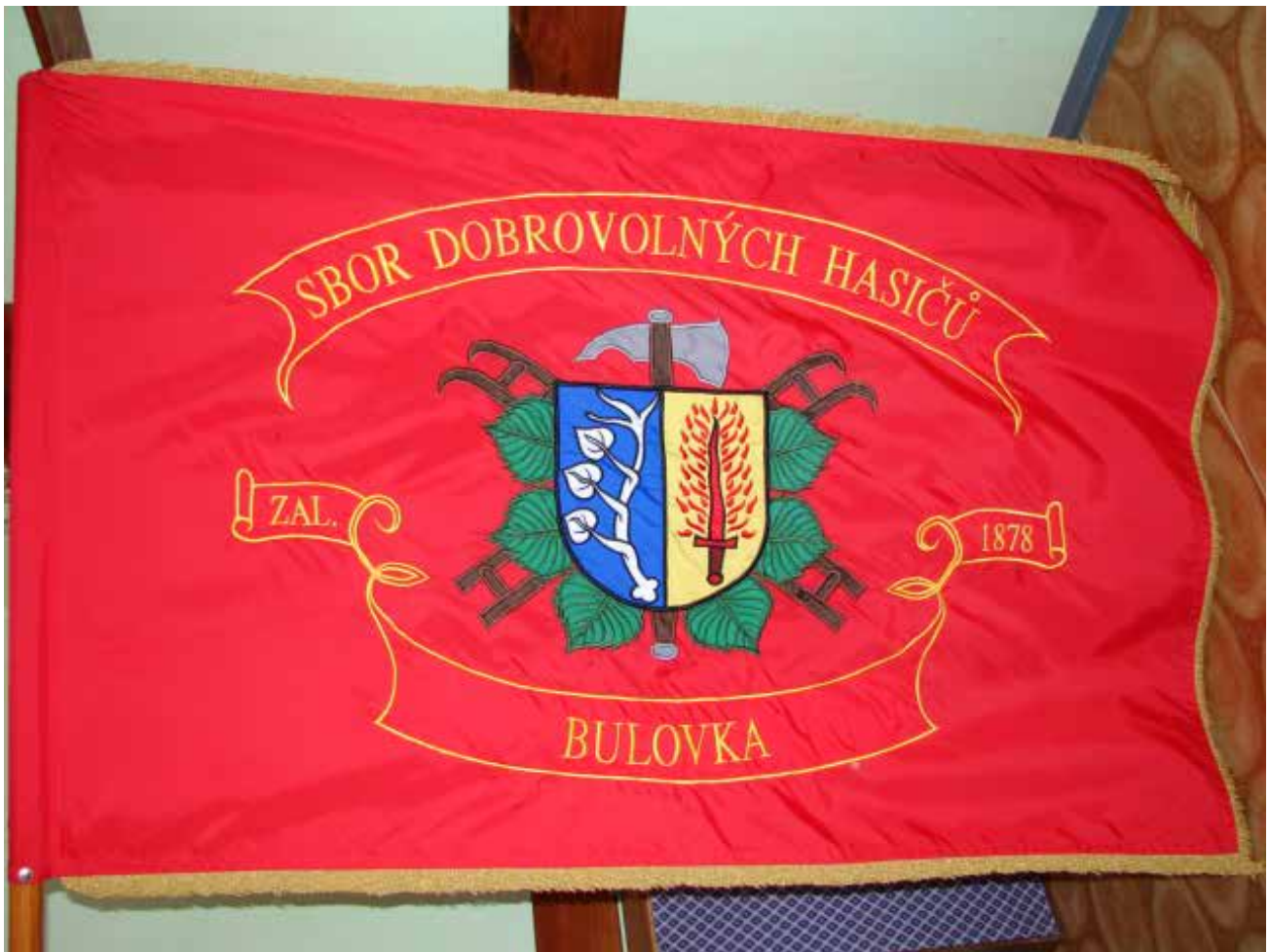
Sbor dobrovolných hasičů Bulovka