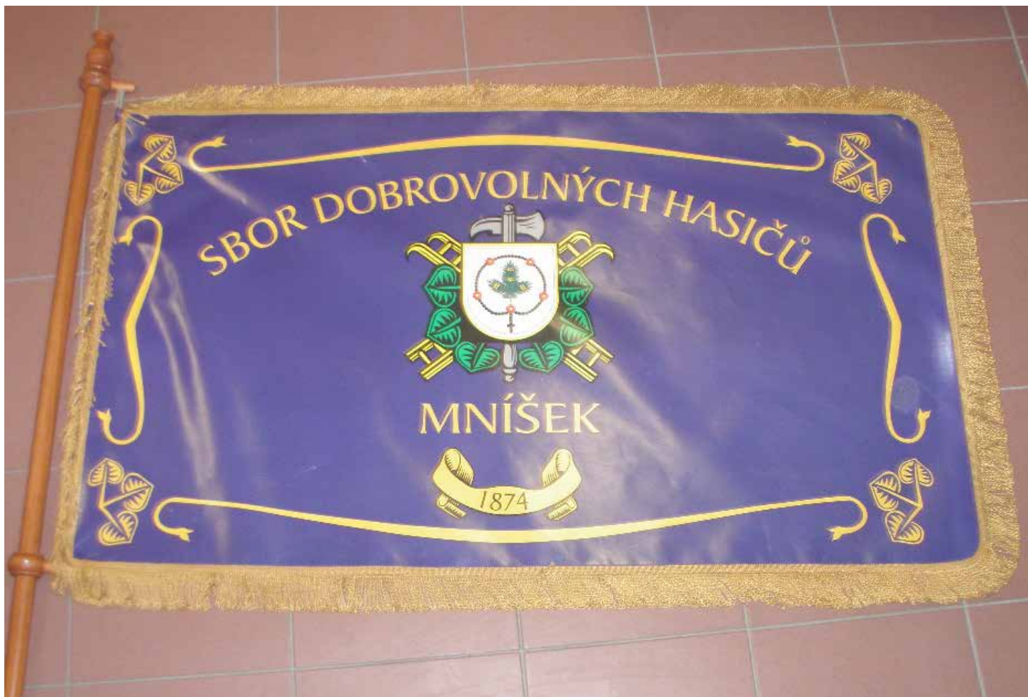
Sbor dobrovolných hasičů Mníšek u Liberce