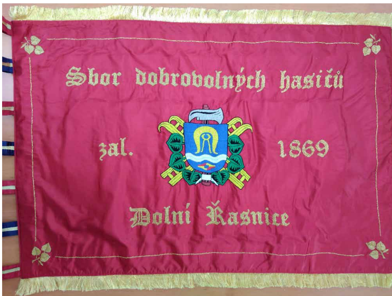
Sbor dobrovolných hasičů Dolní Řasnice