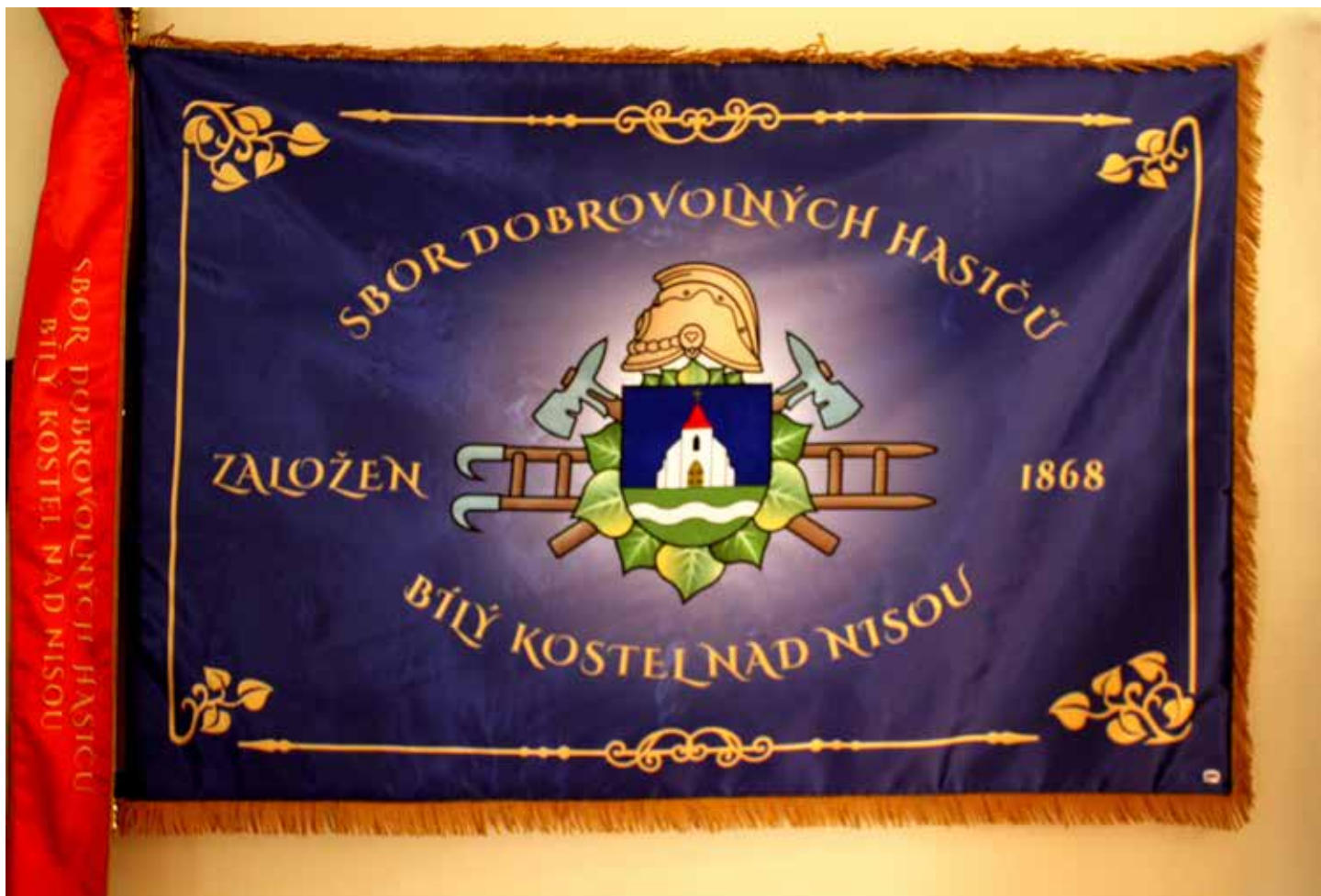
Sbor dobrovolných hasičů Bílý Kostel nad Nisou