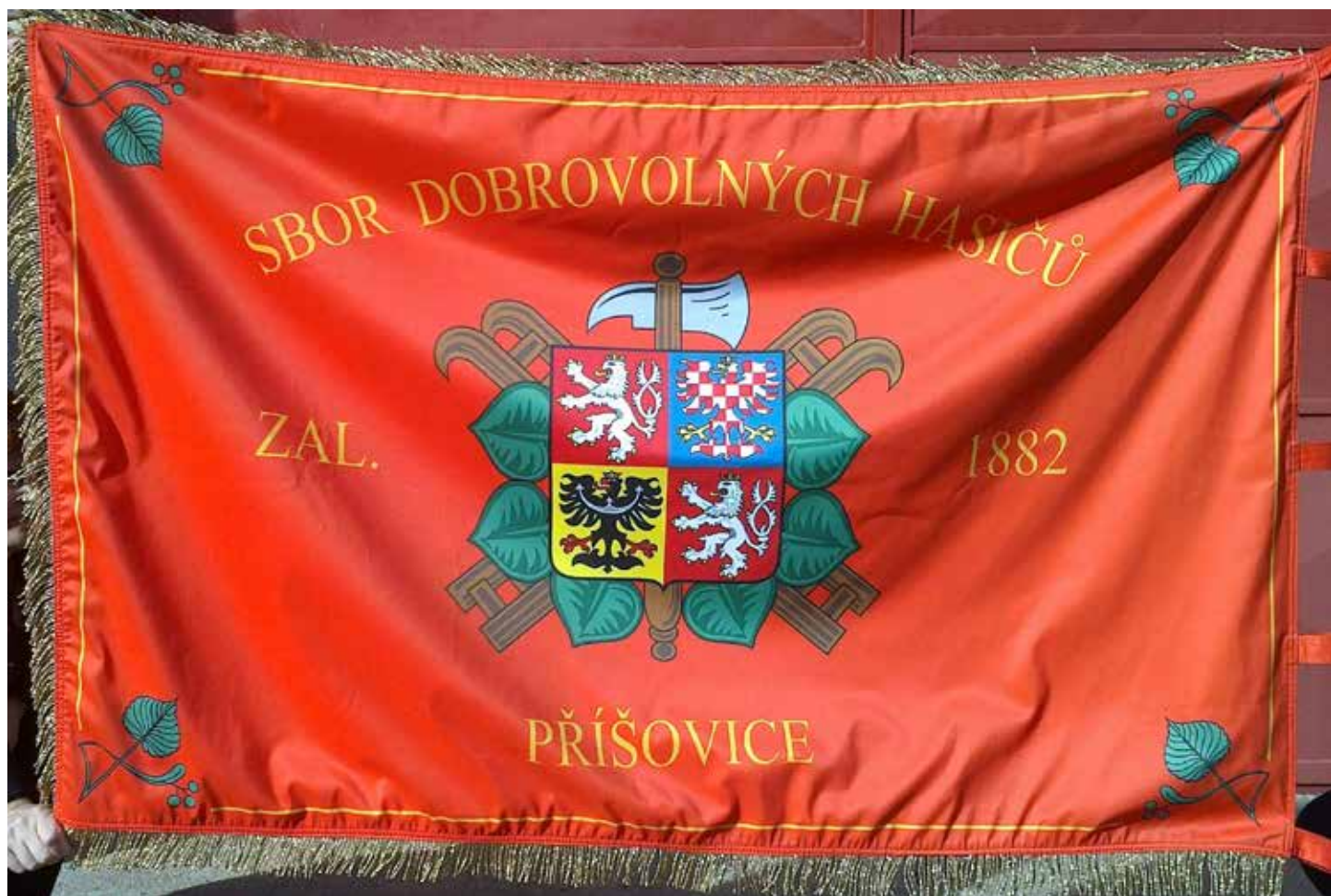
Sbor dobrovolných hasičů Příšovice