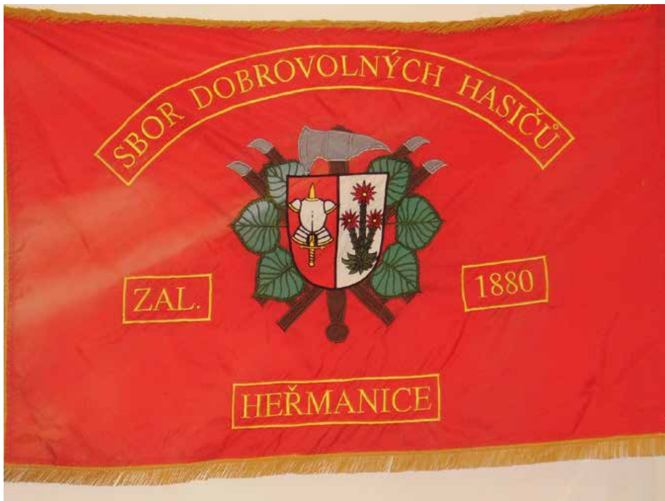
Sbor dobrovolných hasičů Heřmanice