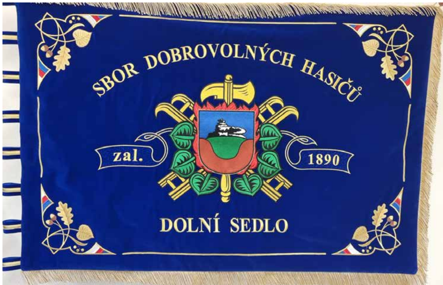
Sbor dobrovolných hasičů Hrádek nad Nisou - Dolní Sedlo