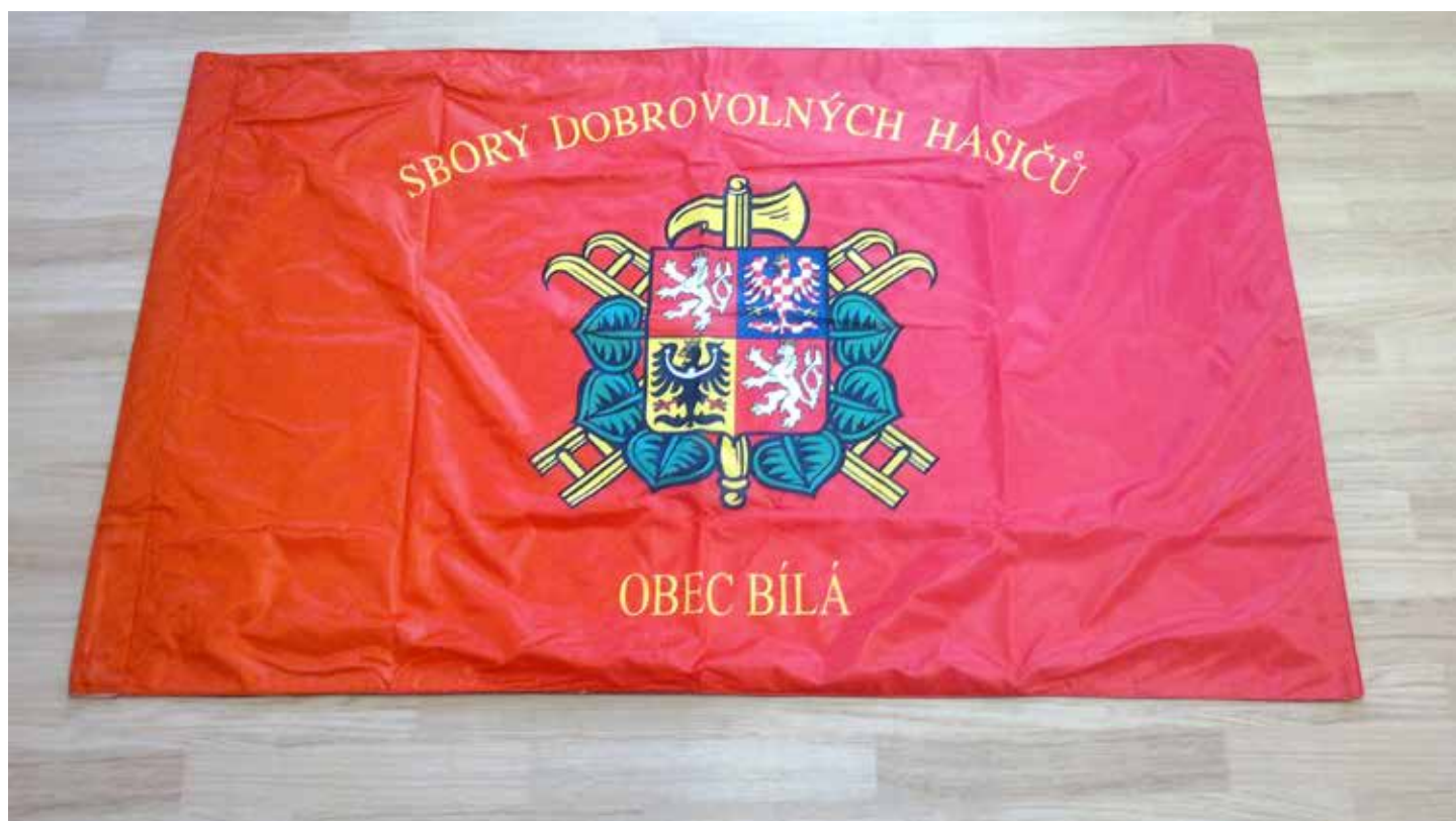
Prapor sborů dobrovolných hasičů obce Bílá