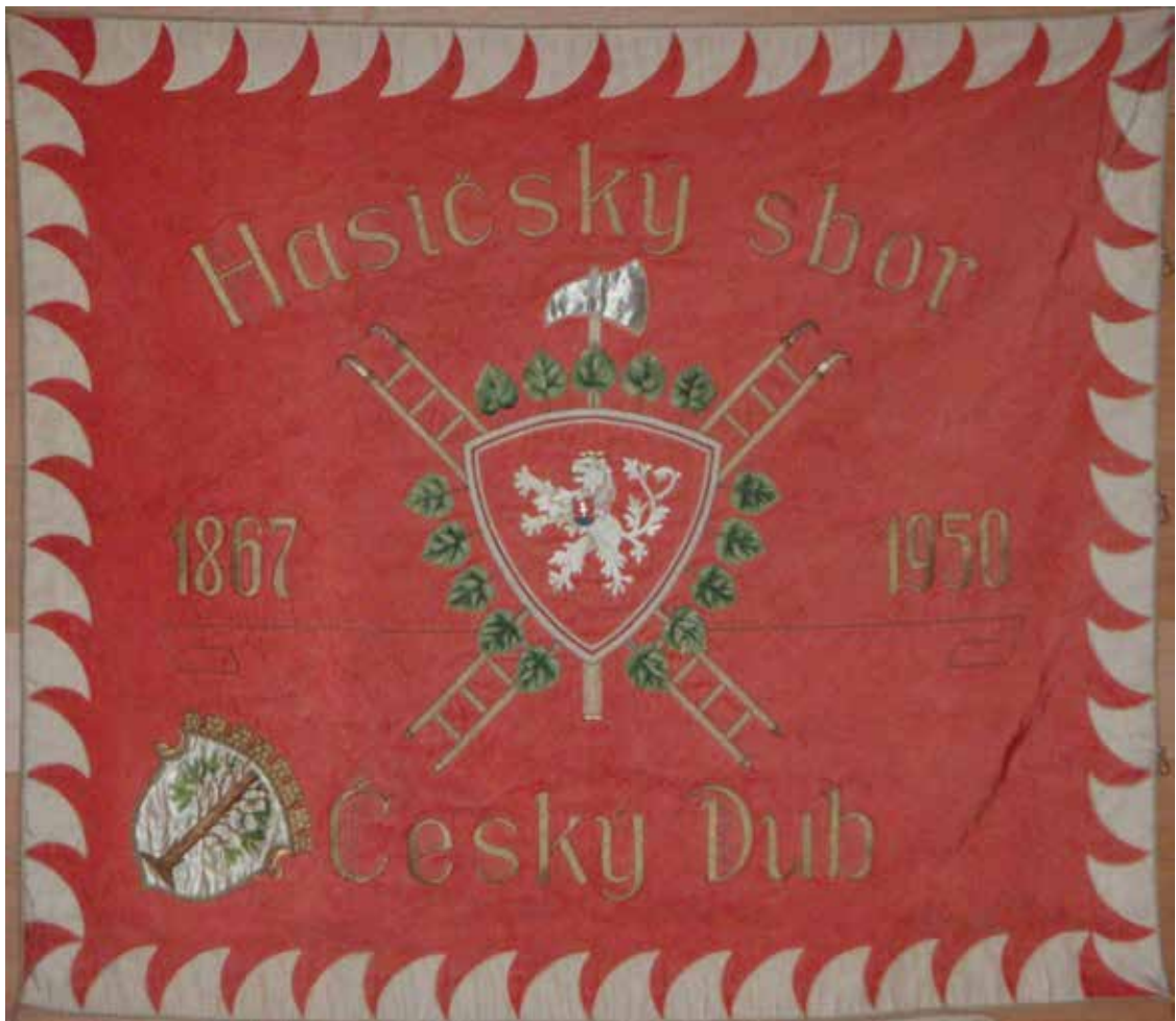
Sbor dobrovolných hasičů Český Dub