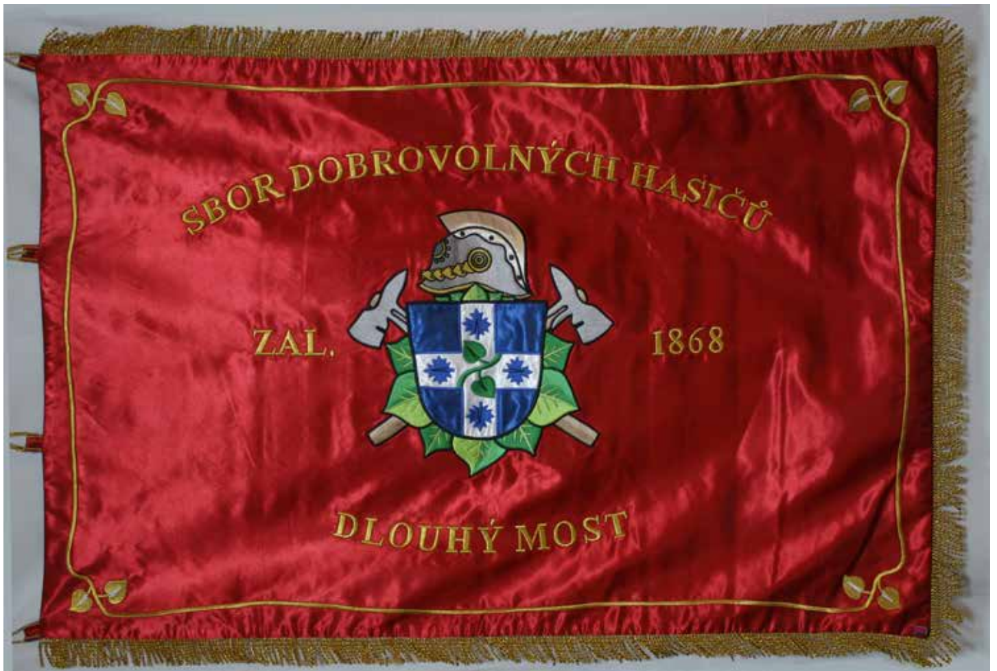
Sbor dobrovolných hasičů Dlouhý Most