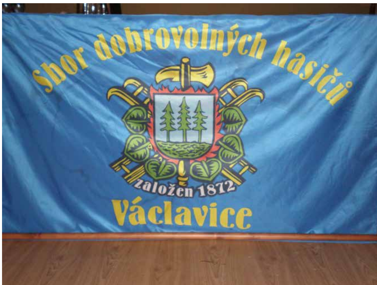
Sbor dobrovolných hasičů Hrádek n. Nisou - Václavice