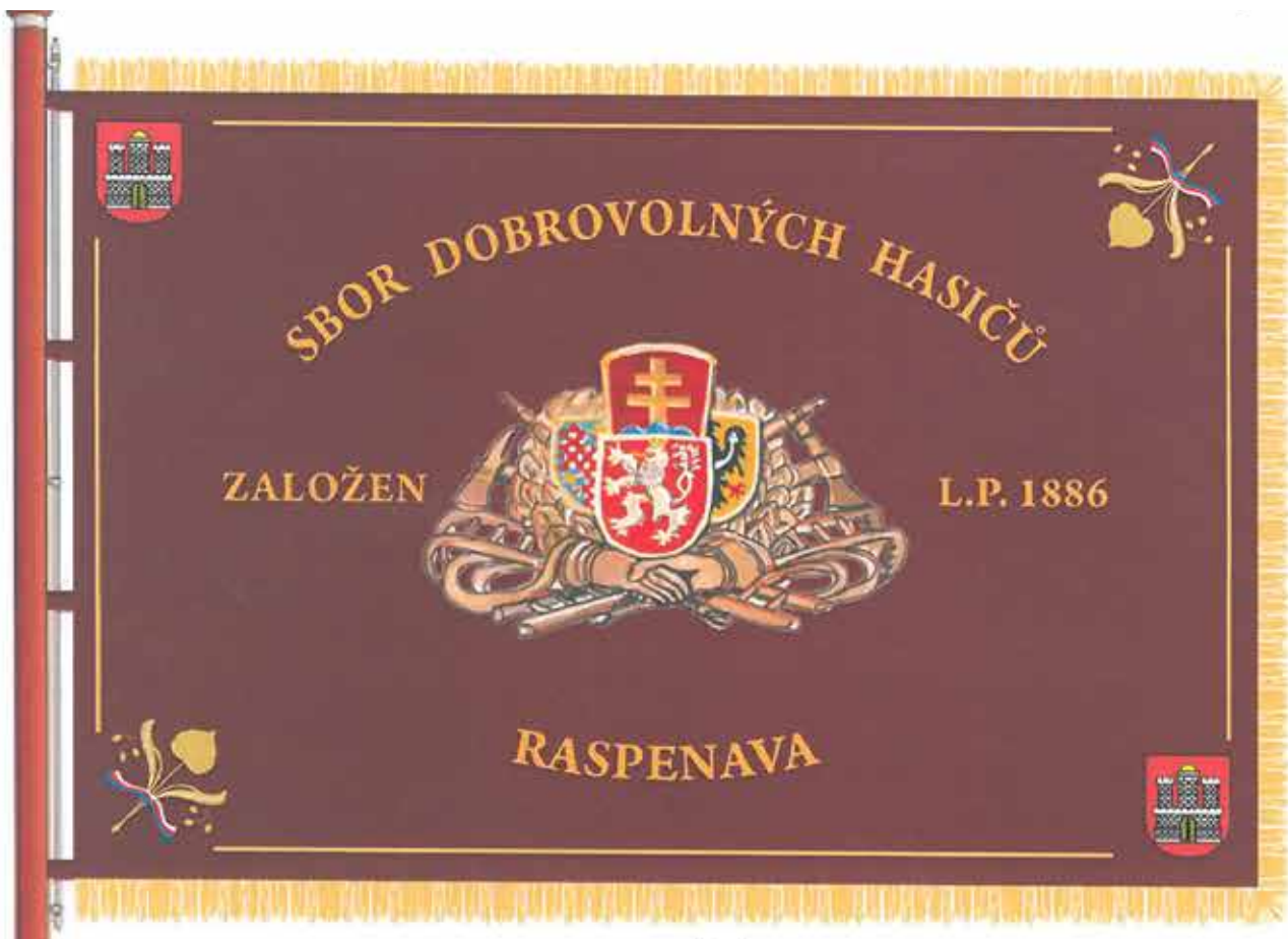
Sbor dobrovolných hasičů Raspenava