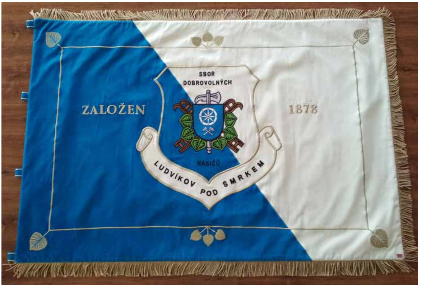
Sbor dobrovolných hasičů Nové Město p. Smrkem - Ludvíkov p. Smrkem