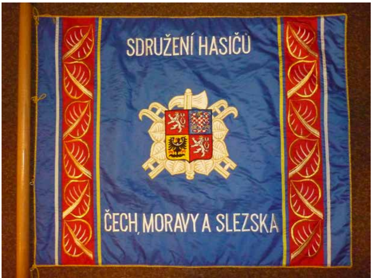
Čestný prapor Sdružení hasičů Čech, Moravy a Slezska udělovaný po roce 1991 do dnešní doby (Hodkovice n. Mohelkou, Liberec - Horní Hanychov, Liberec - Pilínkov, Radimovice, Liberec - Růžodol I., Stráž n. Nisou, Liberec - Vesec)