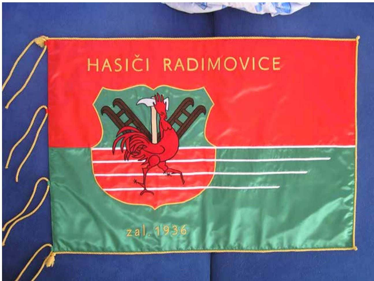
Sbor dobrovolných hasičů Radimovice