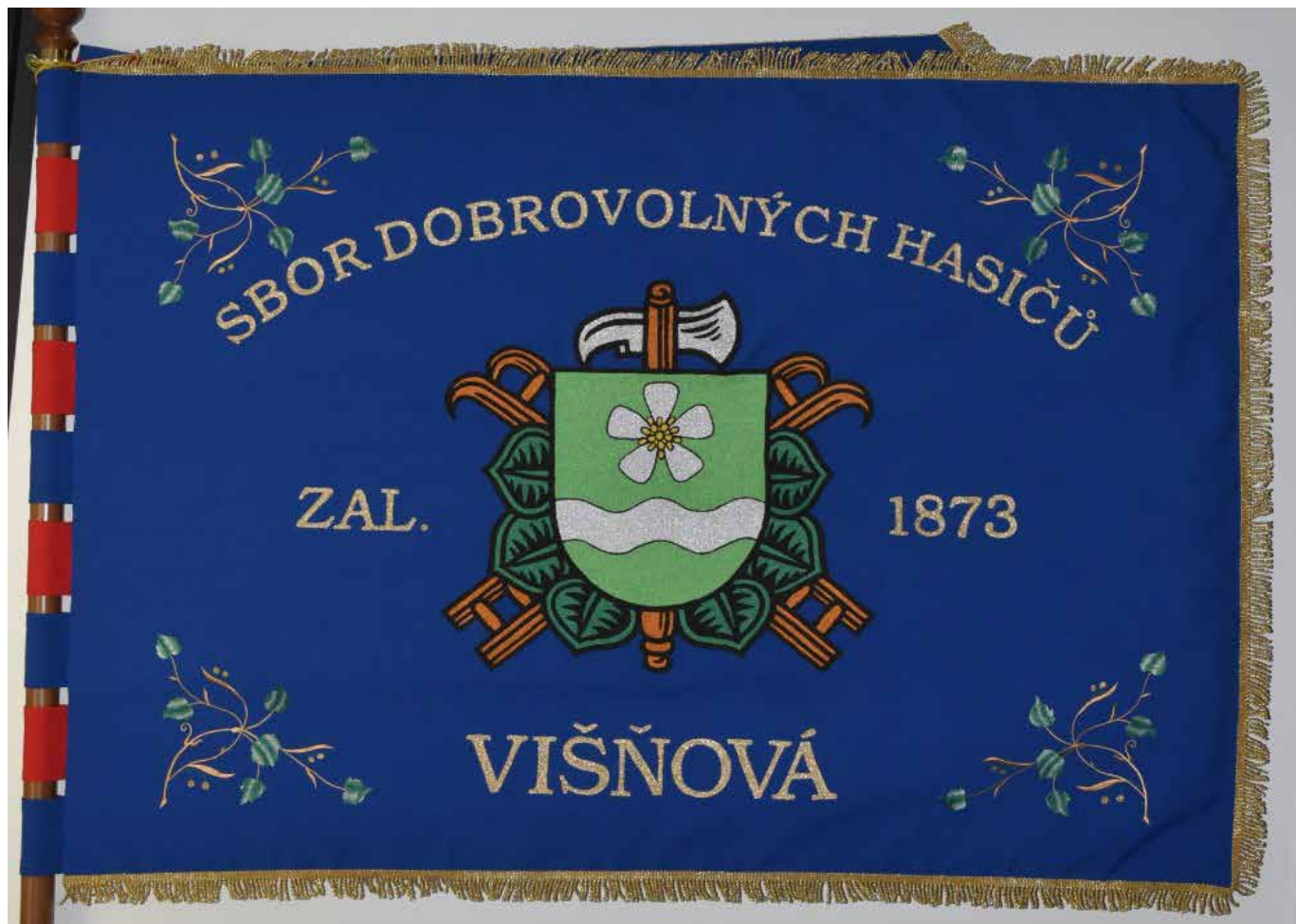
Sbor dobrovolných hasičů Višňová