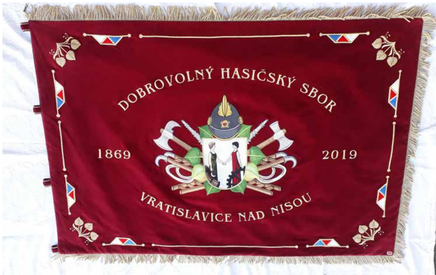
Sbor dobrovolných hasičů Liberec - Vratislavice n. Nisou