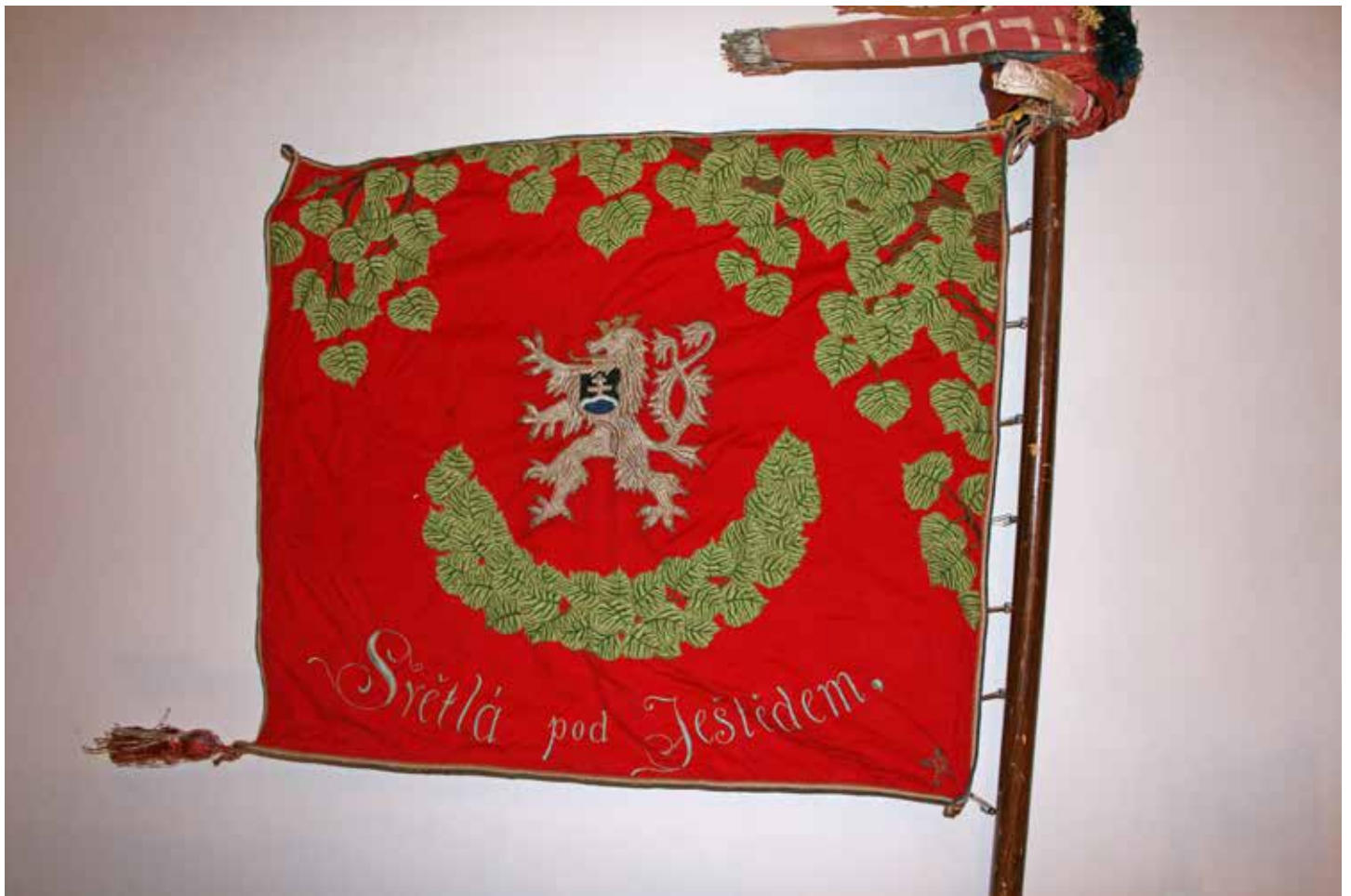
Sbor dobrovolných hasičů Světlá pod Ještědem