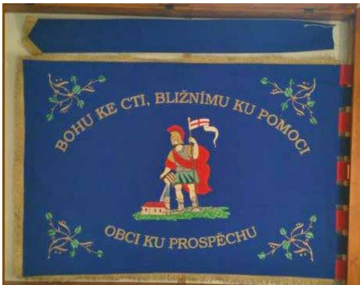
Sbor dobrovolných hasičů Dětrichov