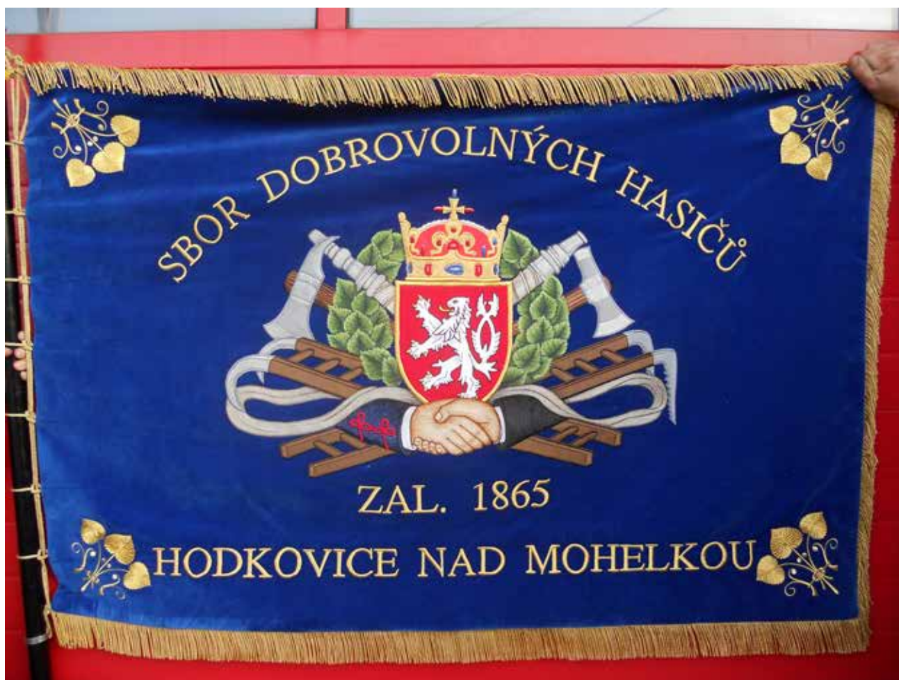
Sbor dobrovolných hasičů Hodkovice nad Mohelkou