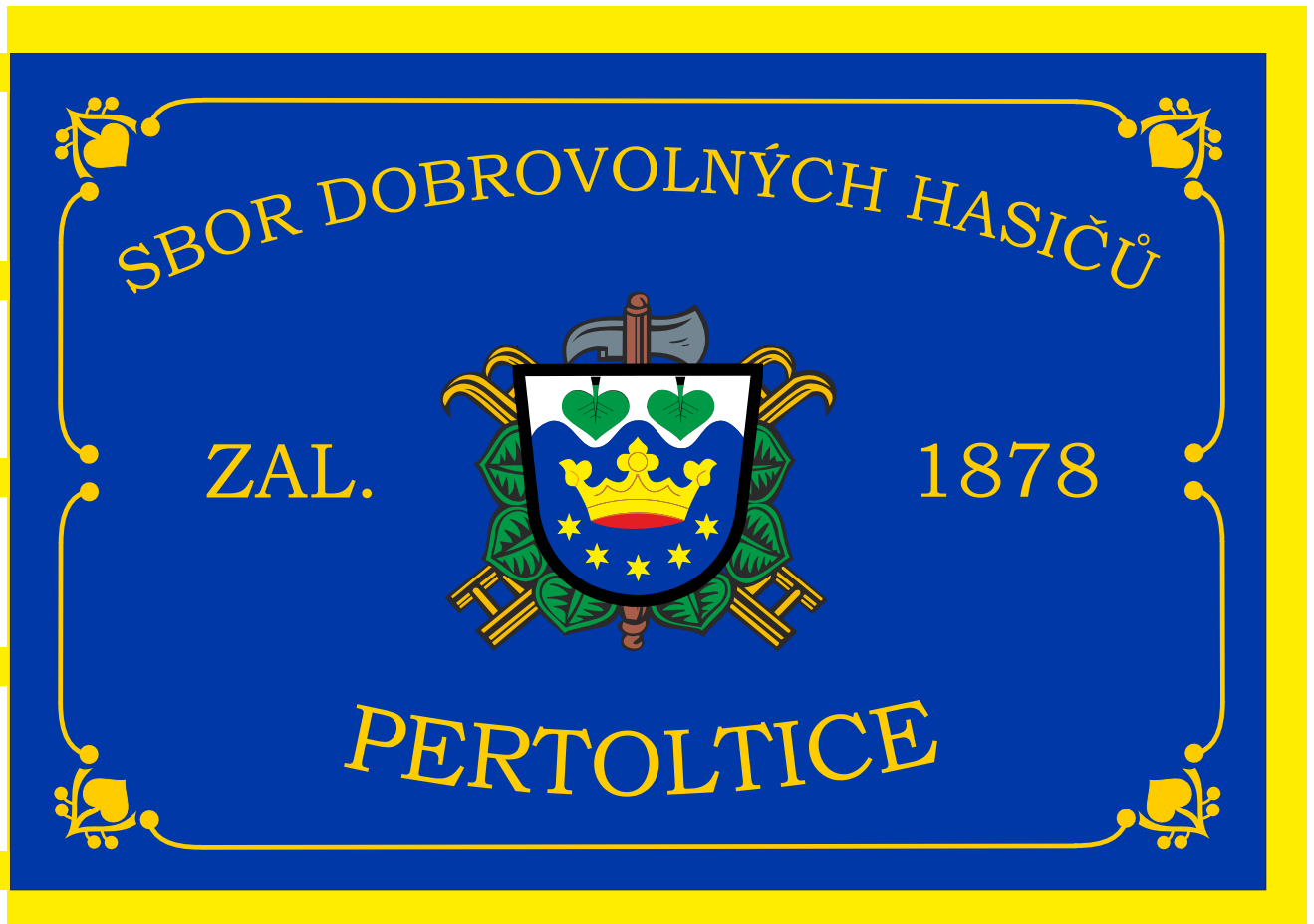
Sbor dobrovolných hasičů Pertoltice