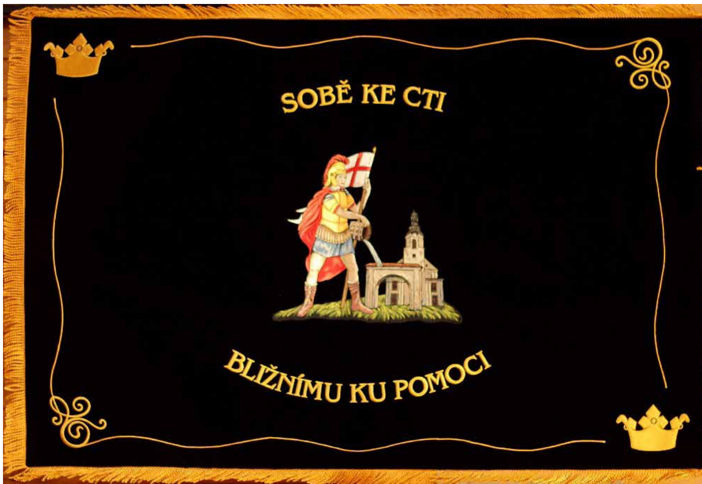
Sbor dobrovolných hasičů Stráž nad Nisou