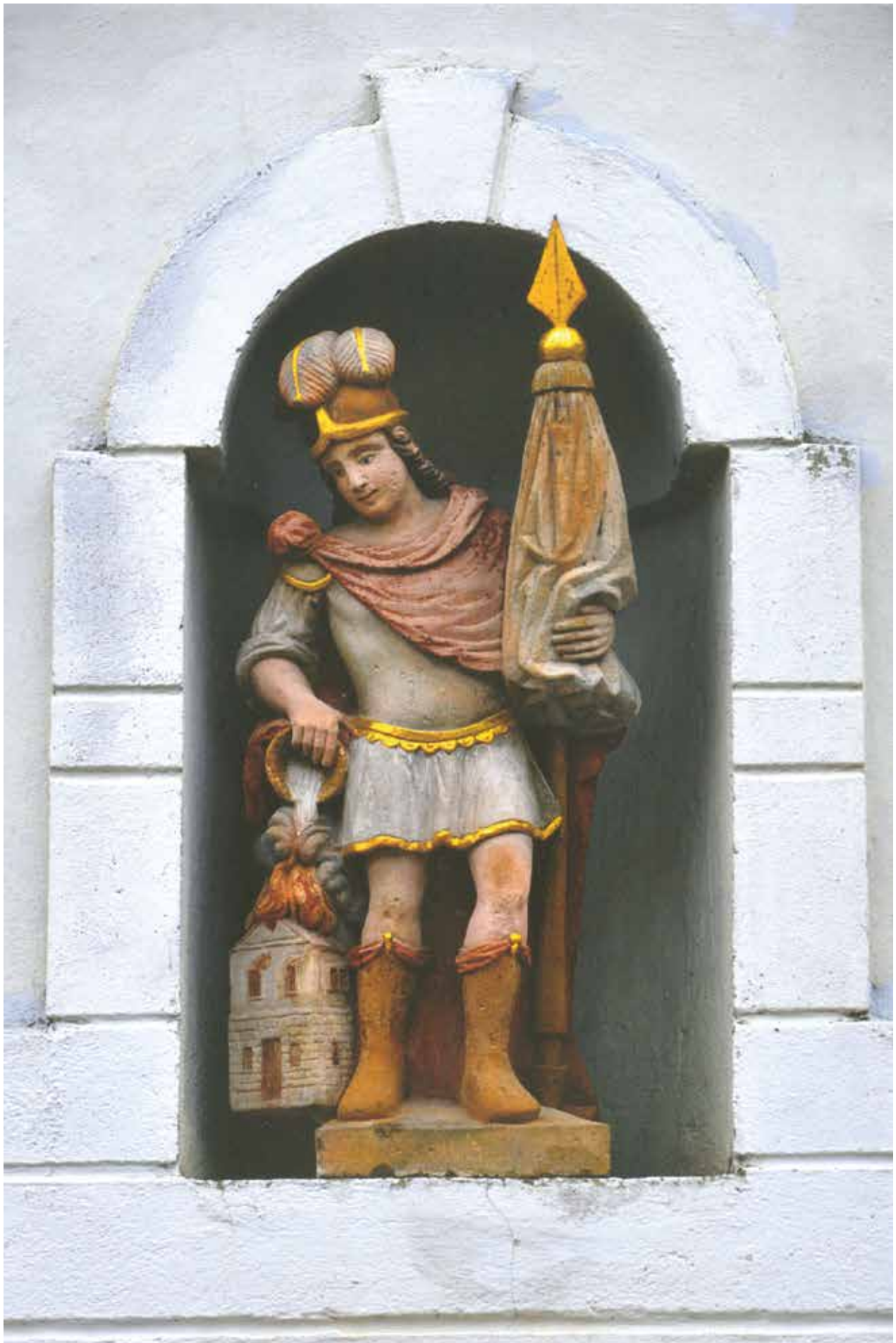
Svatý Florián - patron hasičů