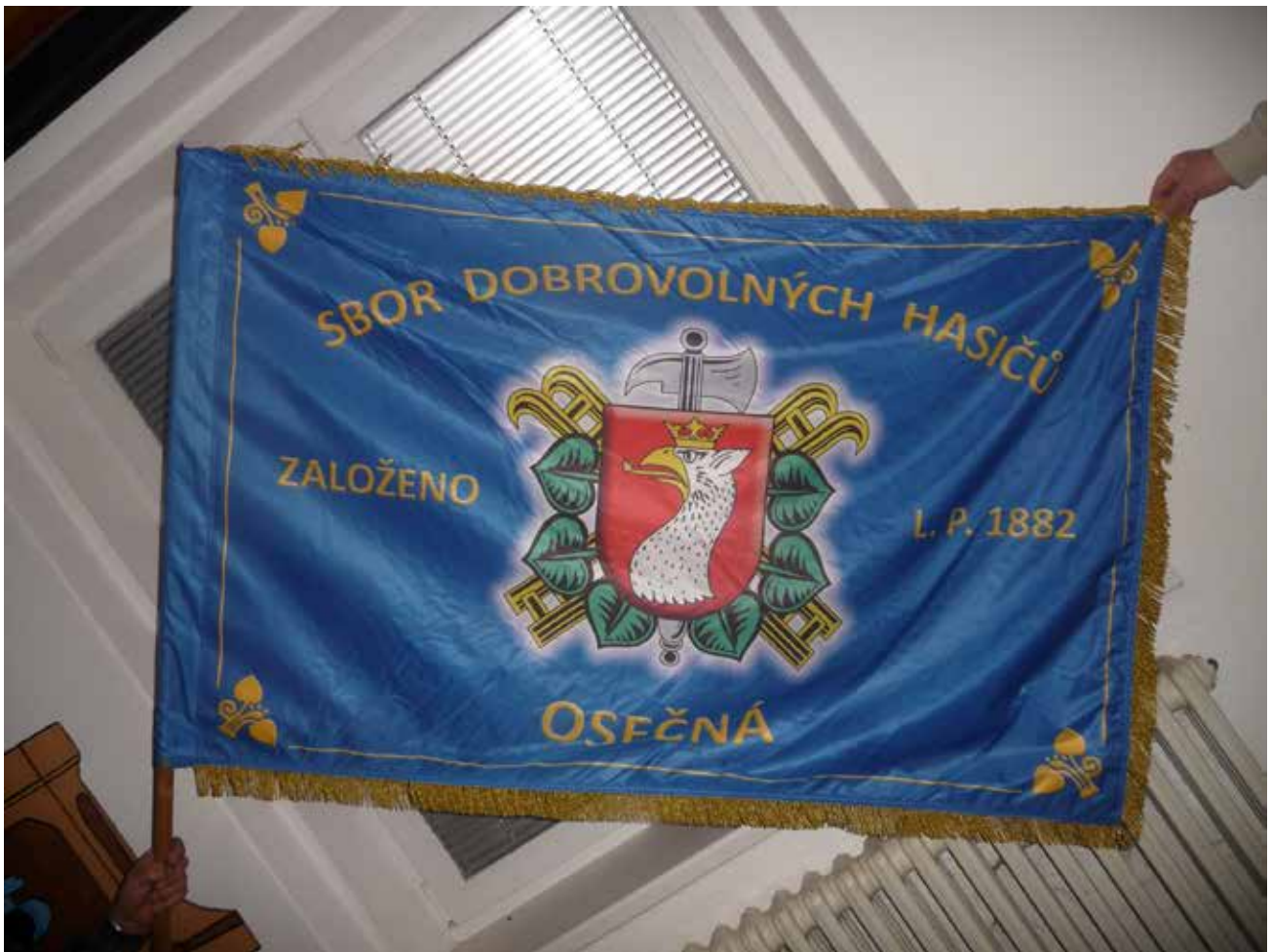
Sbor dobrovolných hasičů Osečná