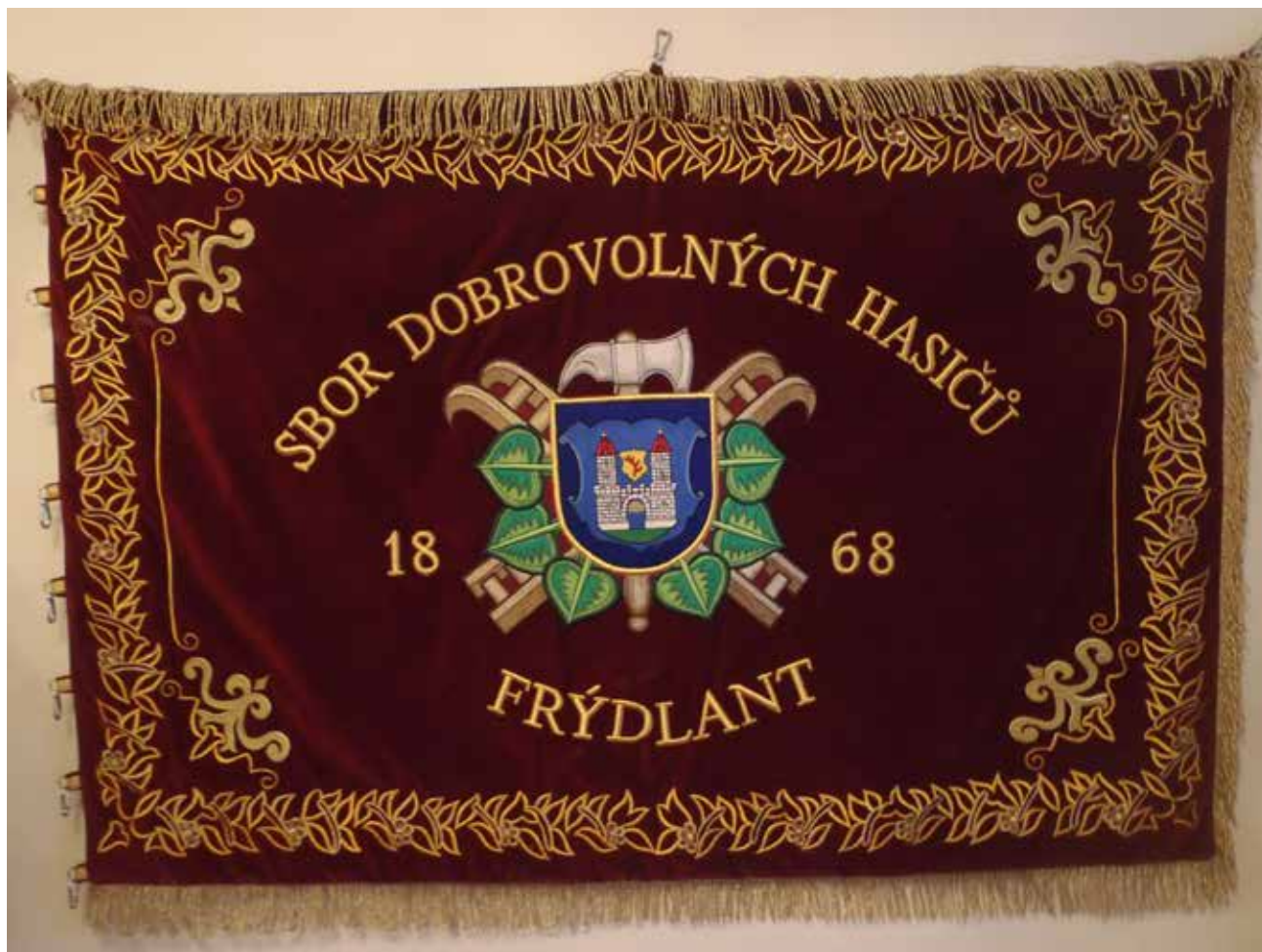
Sbor dobrovolných hasičů Frýdlant v Čechách