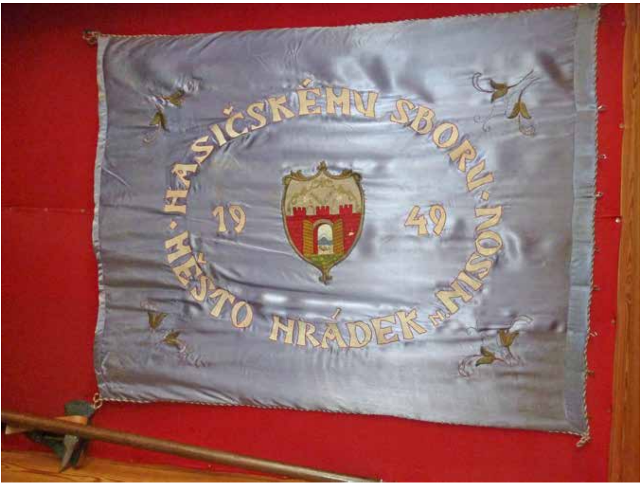
Sbor dobrovolných hasičů Hrádek nad Nisou