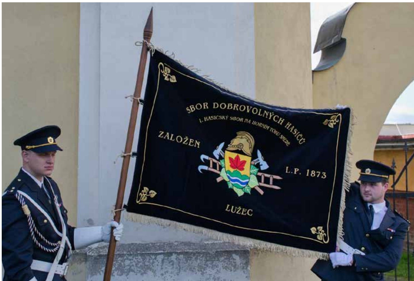
Sbor dobrovolných hasičů Raspenava - Lužec