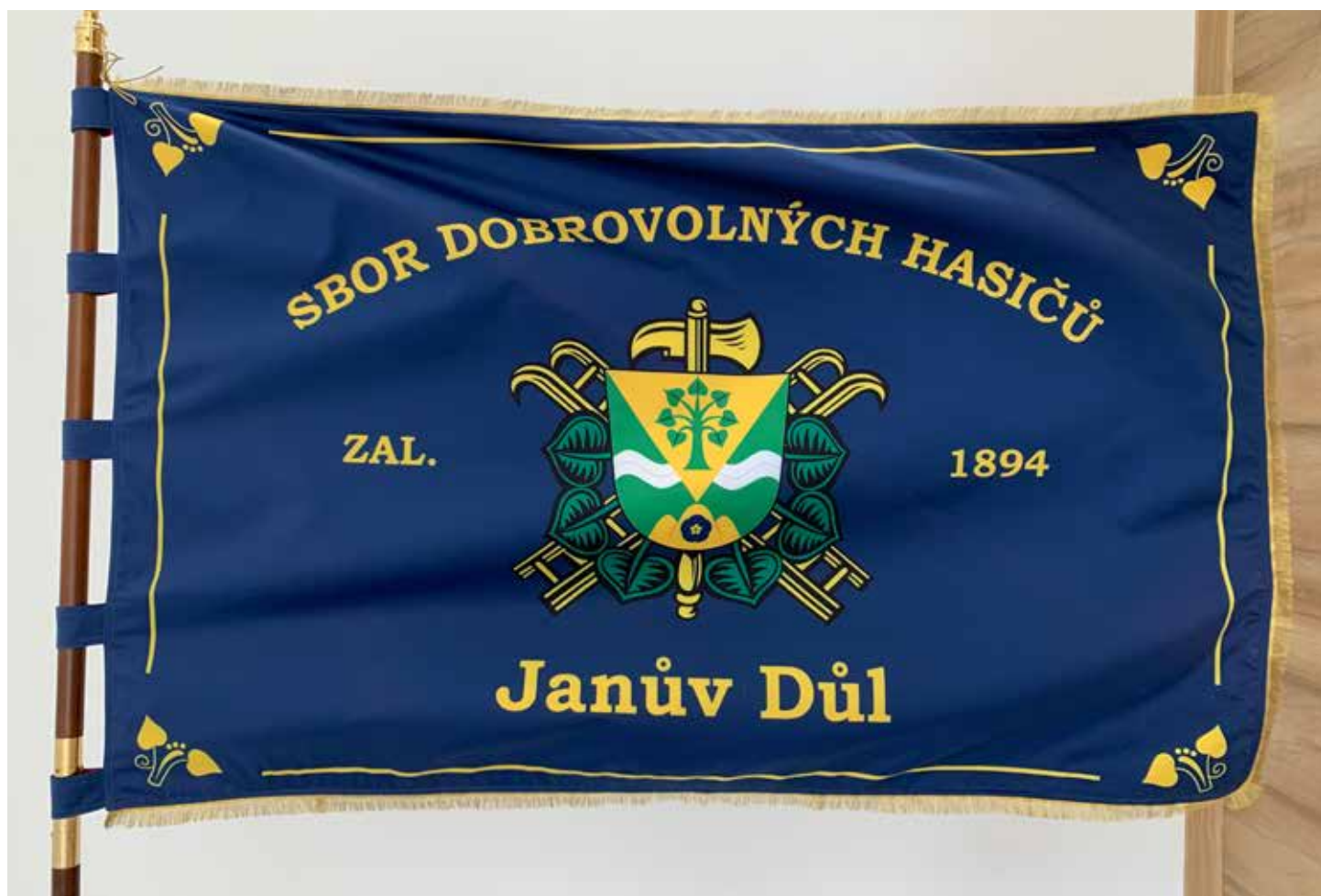
Sbor dobrovolných hasičů Janův Důl