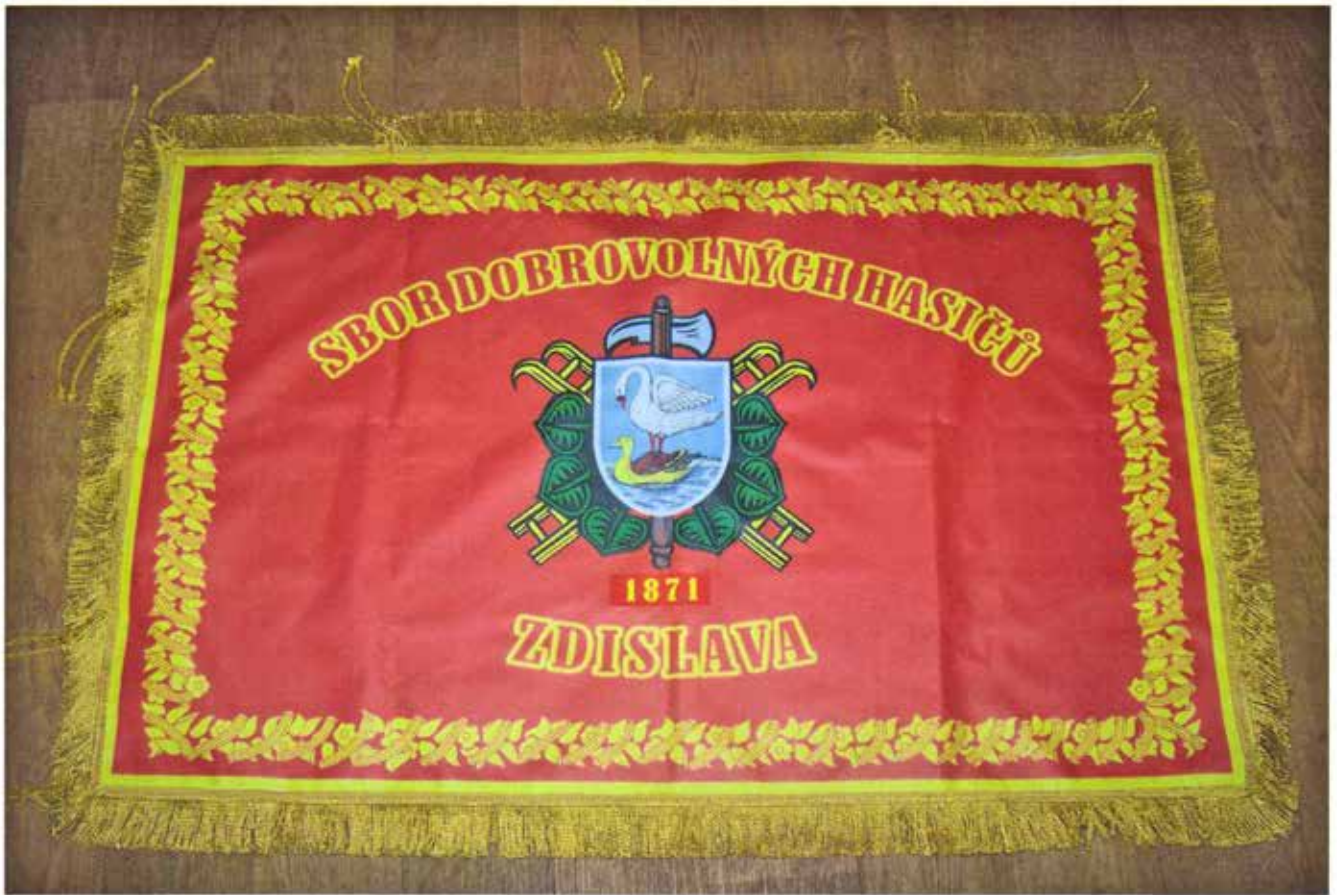
Sbor dobrovolných hasičů Zdislava