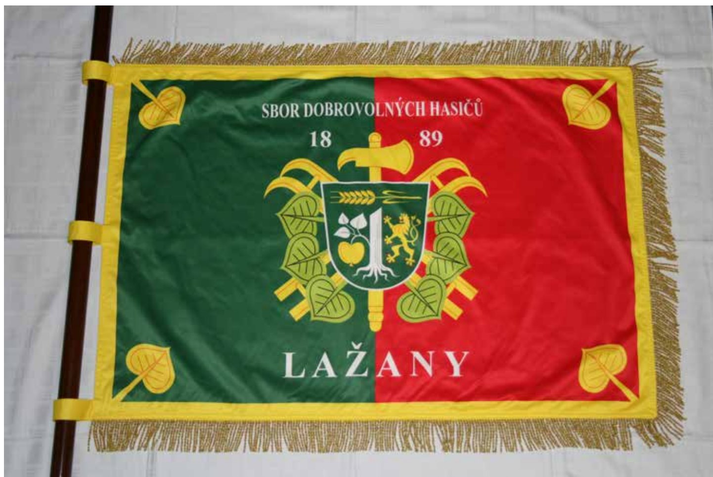
Sbor dobrovolných hasičů Lažany