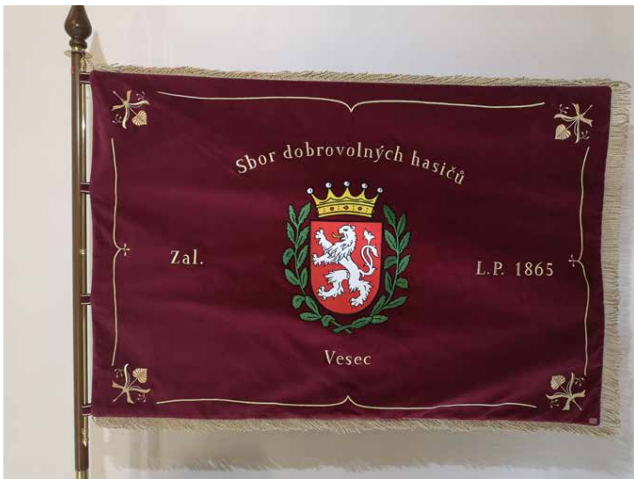
Sbor dobrovolných hasičů Liberec - Vesec