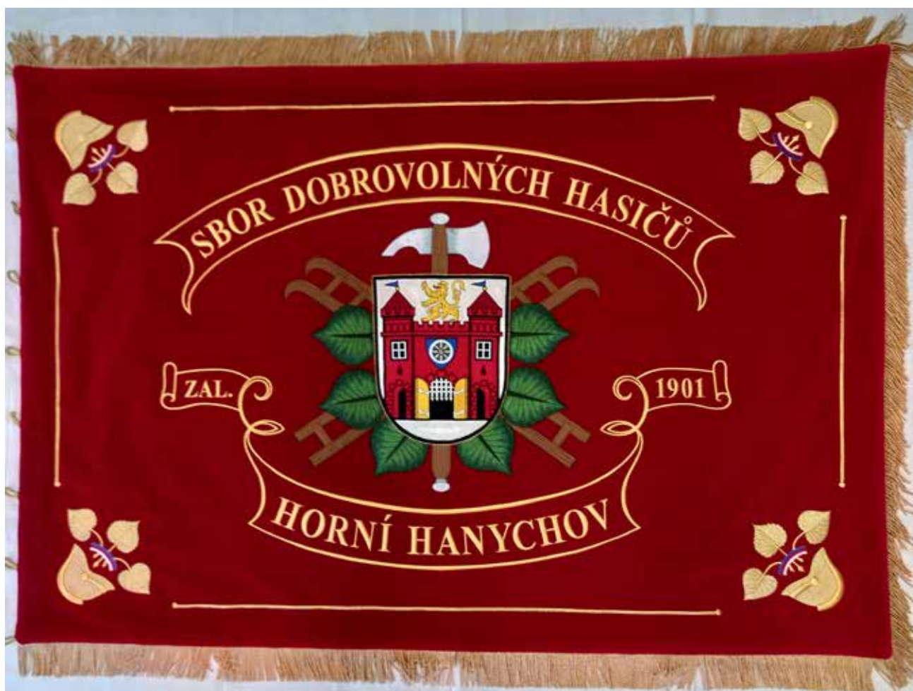
Sbor dobrovolných hasičů Liberec - Horní Hanychov