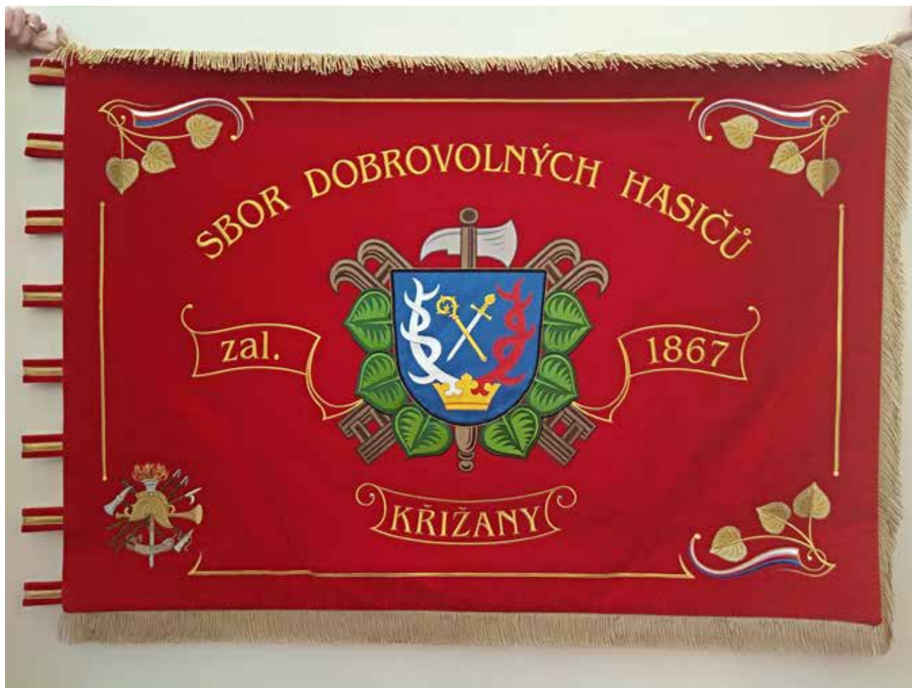
Sbor dobrovolných hasičů Křižany