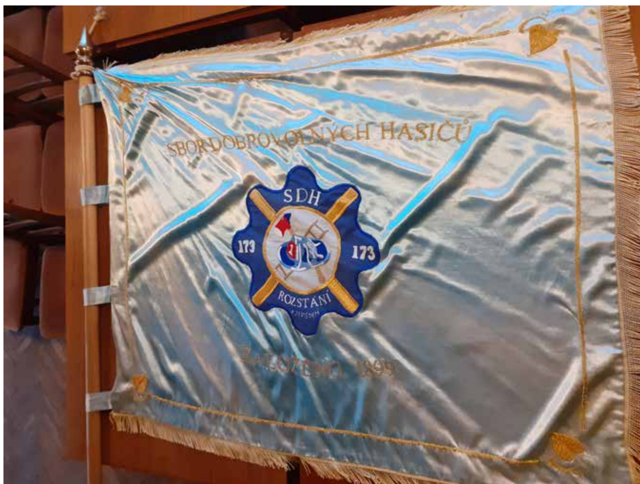
Sbor dobrovolných hasičů Světlá pod Ještědem - Rozstání