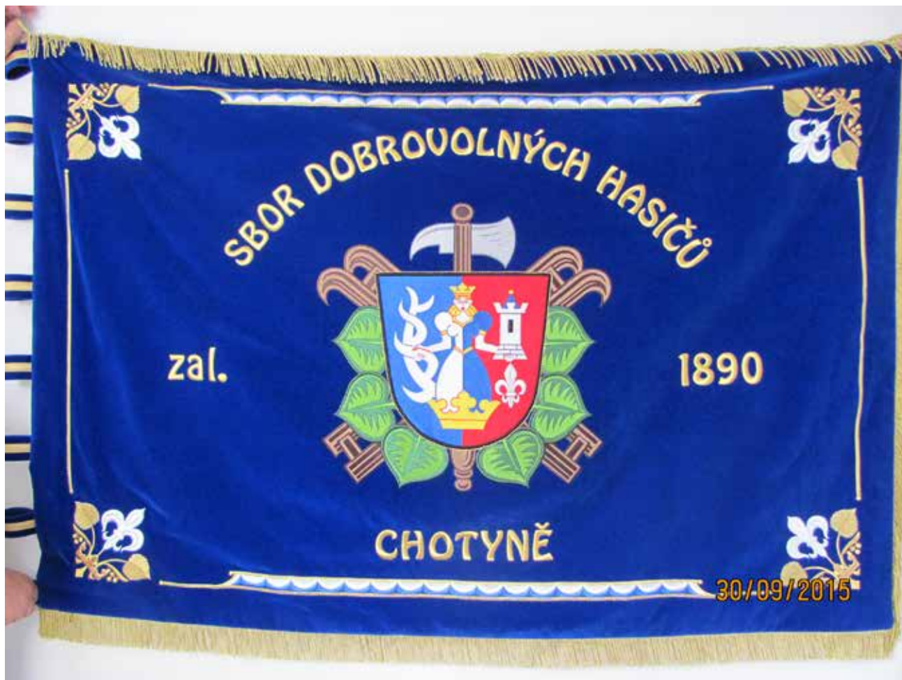
Sbor dobrovolných hasičů Chotyně