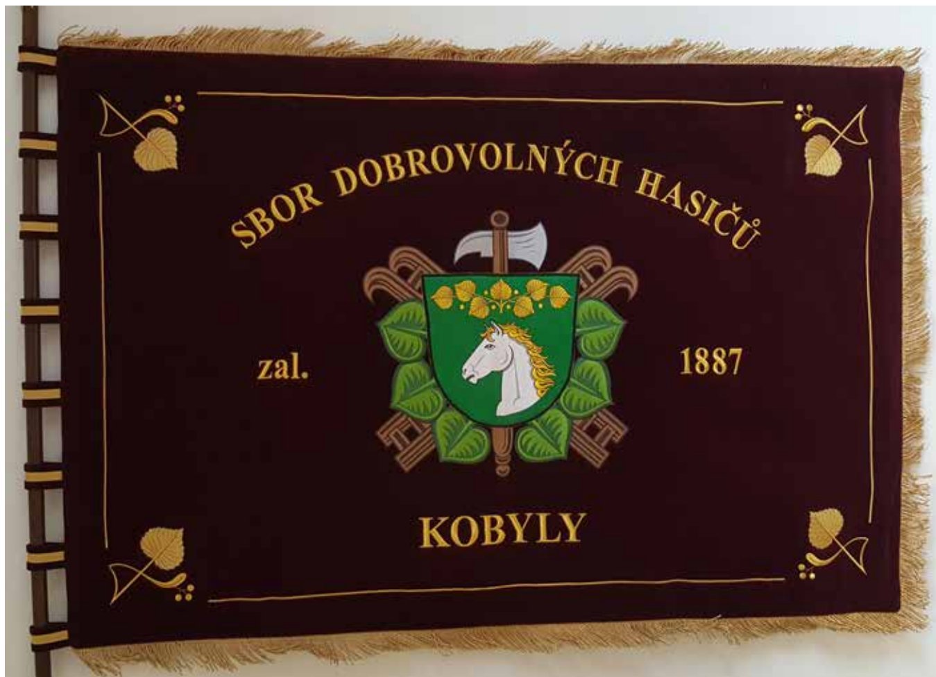
Sbor dobrovolných hasičů Kobylá